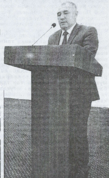
Суратда: томоша залида талаба ёшларни институт ректори Алишер Усманкулов табрикламоқда.